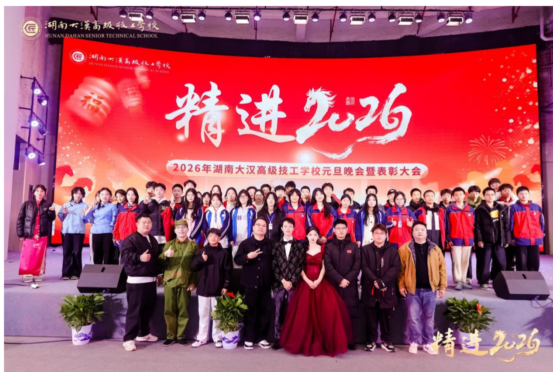
图 17:2026 年元旦晚会现场合影