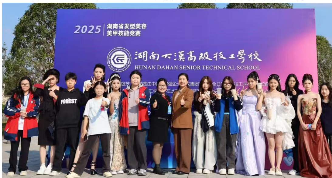
图 36：形象设计专业学生第 27 届湖南省发型美容美甲技能竞赛