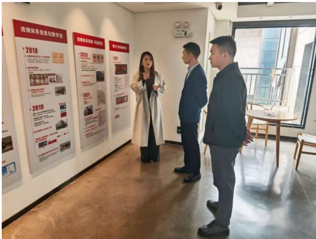
图26：学校领导前往大碗先生调研

结合调研结果，精准梳理课程痛点与优化方向，将企业真实工作任务、操作标准融入课程内容，推动课程设置从“学科导向”向“岗位导向”转变，为课程改革提供坚实的产业依据。形象设计专业开发“美容化妆+商业造型”一体化课程，引入行业前沿技术标准，学生职业技能证书覆盖率达98%；汽车维修专业构建“理论教学+实训操作+故障诊断”教学体系，依托升级后的实训设备开展沉浸式教学；烹饪专业推行“食材采购—菜品研发—市场售卖”全流程教学，通过学生义卖、西点售卖等活动实现教学与创收双赢。