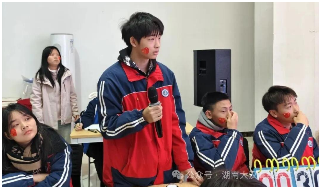
图 7：第四届党史知识竞赛学生抢答

案例 1：《党史知识竞赛，传承红色基因》。在深入贯彻党的教育方针、全面落实立德树人根本任务的背景下，学校深刻认识到，教育质量的全面提升不仅体现在学业成绩与技能培养上，更关乎学生核心素养的全面发展与正确价值观的牢固确立。为此，学校从 2022 年开始每年 12 月份，精心策划并成功举办面向全校师生的“学党史、强信念、跟党走”党史知识竞赛活动，2025 年 12 月 25 日，湖南大汉高级技工学校在 D401 会议室隆重举行了“学史增智担使命 薪火相传建新功”第四届党史知识竞赛决赛。