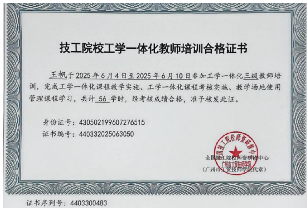
图29：全国技工院校工学一体化三级教师培训

课程思政研修、专业技能集训，夯实教师教学基本功；搭建校企协同培养平台，组织教师深入企业生产一线参与项目研发、设备调试，提升实践教学能力；鼓励教师参加行业技能培训、跨校交流访学，及时掌握行业前沿技术与教育教学新理念。育教学新理念。