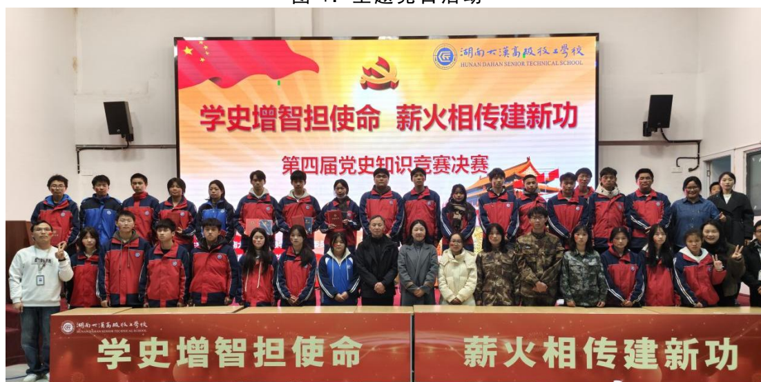
图 5：第四届党史知识竞赛