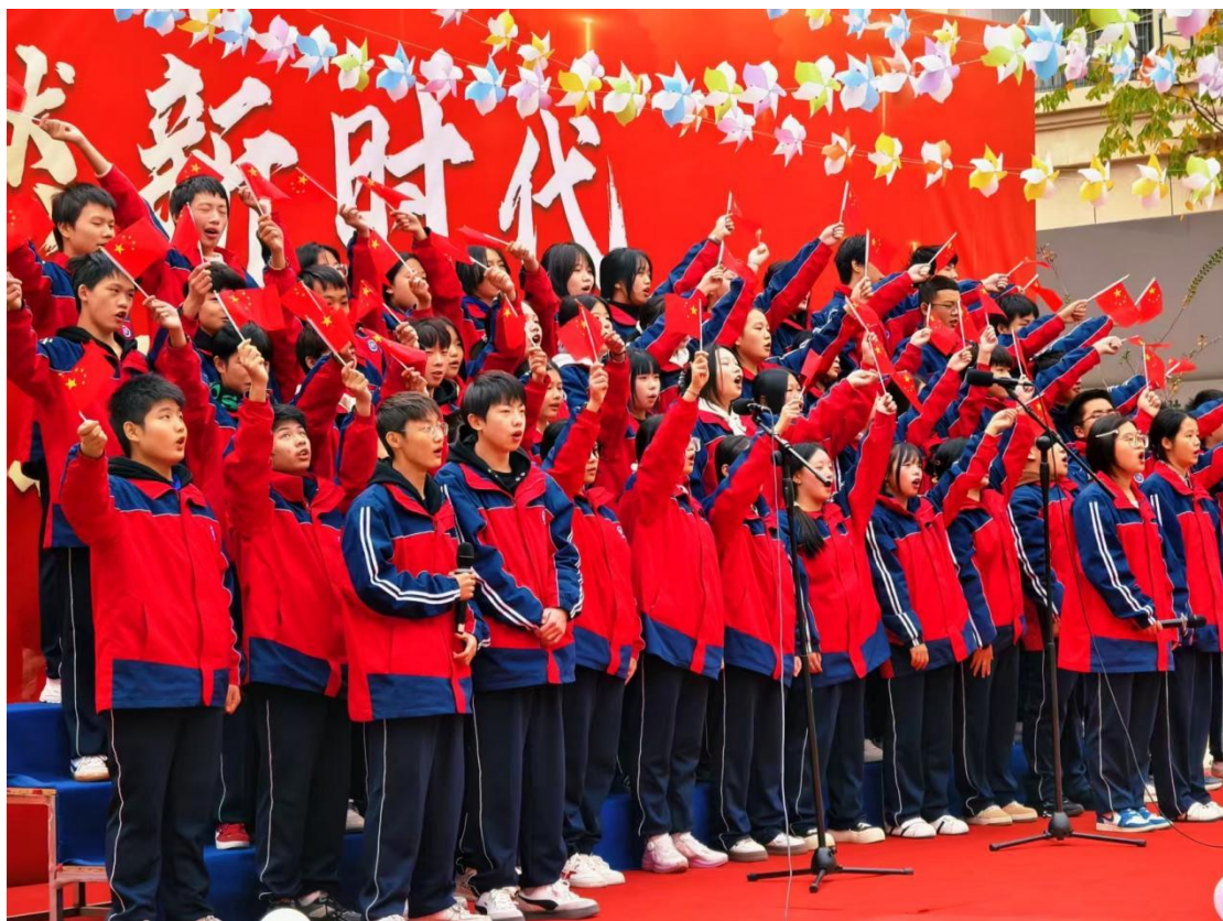
图 8：歌燃新时代，技筑梦之程红歌比赛

积极探索新时代爱国主义教育的创新路径。每年10月，学校精心策划校园红歌比赛。将音乐的美育功能与思政教育的价值引领深度融合，打造一堂“声”入人心、“情”润成长的生动思政大课，全面提升校园文化育人品质，2025年10月“歌燃新时代，技筑梦之程”红歌比赛，它用艺术的音符串联起历史的脉络，用青春的歌声澎湃着时代的心跳，真正实现了以文化人、以美育人、以情动人的教育效果。学校将以此为契机，引导广大师生在历史的回响与时代的强音中，坚定信仰，砥砺前行，为实现中华民族伟大复兴的中国梦贡献磅礴的青春力量。