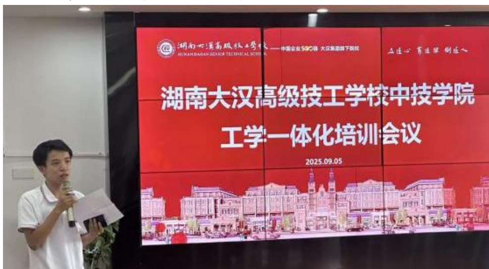
图 33：工学一体化三级课程校级培训

教研活动常态化提质。以5个教研组为单位，坚持每周开展专题教研活动，围绕课程设计、教学方法优化等核心议题深入研讨，形成“集体备课—观摩交流—反思改进”的良性循环。选派骨干赴广东参加全国工学一体化三级教师培训，返校后开展3次校内辐射培训。同步组织教师参与“课通天下大讲堂”工学一体化线上课程学习，推动教学理念与技能同步升级。