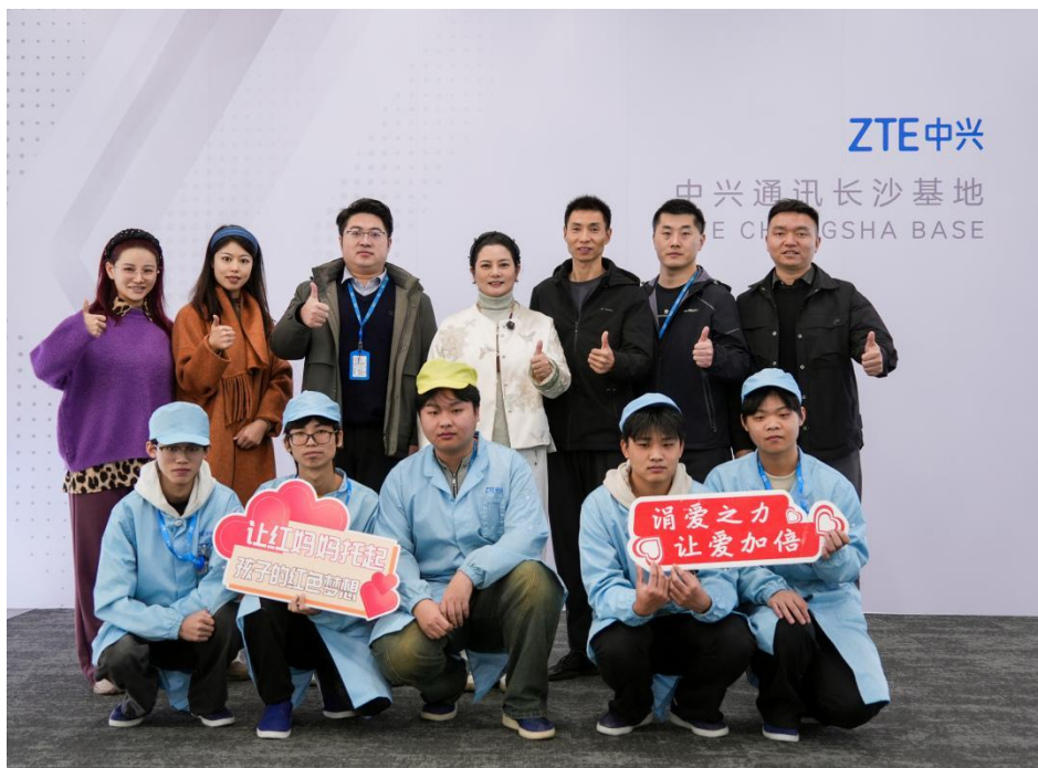
图19：学校领导回访看望中兴实习就业学生

通过校企双导师评价、学生自评、实习单位考核相结合的方式开展综合评价，本年度实习合格率达98.6%，其中优秀率22%。企业反馈显示，89%的学生工作态度端正、适应能力较强，65%的学生能独立完成岗位核心任务，尤其在实操技能方面表现突出。收集学生实习反馈意见20余条，主要集中在希望增加企业技术培训频次和企业文化宣导等方面。针对反馈问题，学校已优化下年度实习方案。