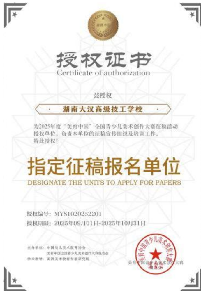
图 37：美育·中国青少儿美术创作大赛