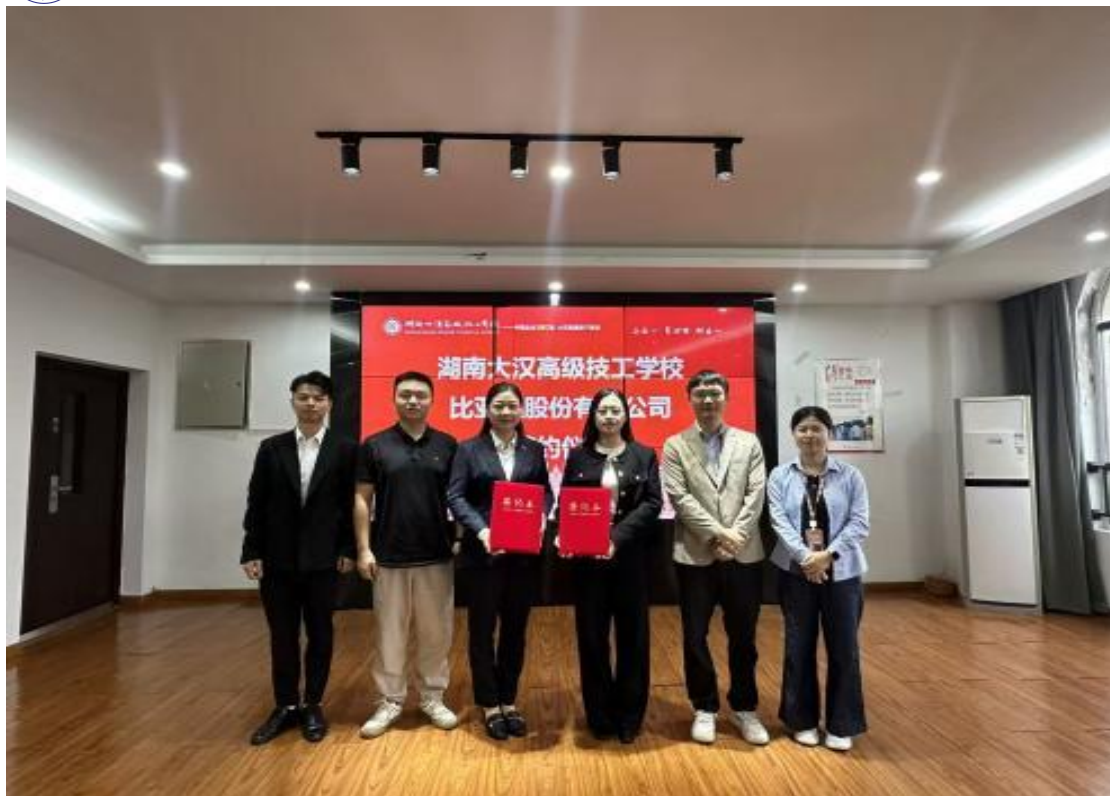
图 1：与比亚迪签订校企合作协议书