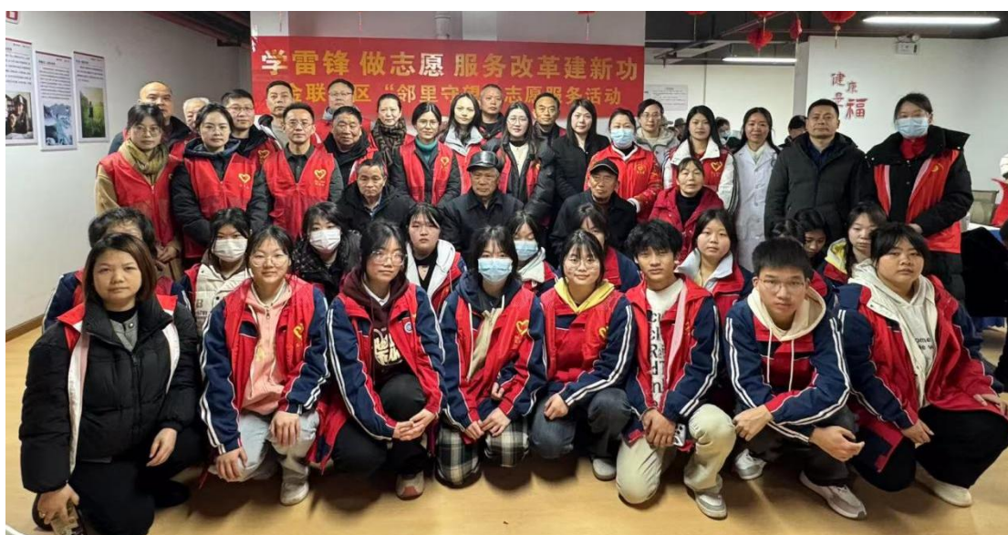
图 10：学生参加社区志愿服务活动合影