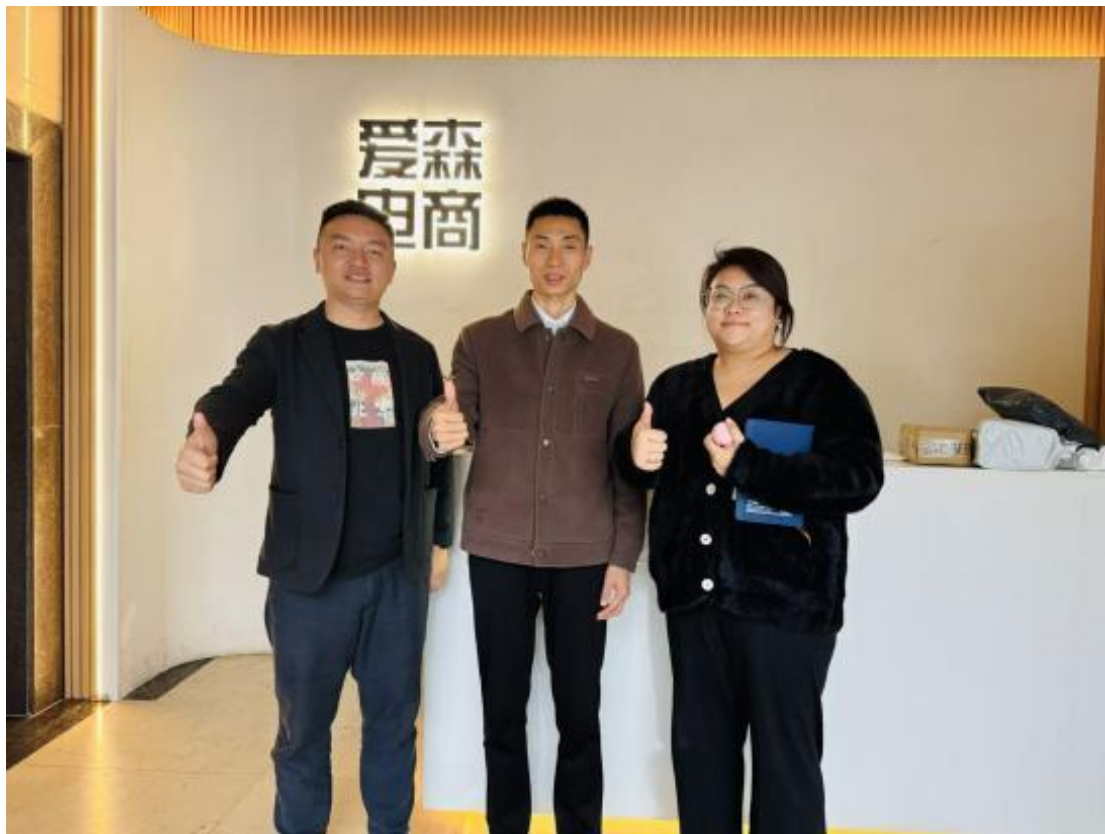
图25：学校领导前往爱森电商调研

深化企业调研，锚定课程改革方向。学校聚焦电商、餐饮等优势专业领域，多次组织教师赴爱森电商、大碗先生等本地标杆企业开展专项调研，深入了解企业岗位核心技能要求与行业发展趋势。