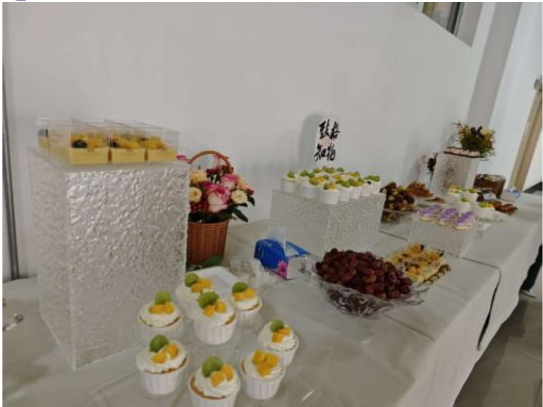
图 27：烹饪学生西点售卖现场

为最大化实训资源效益，学校将各专业实训室向校园及社区开放。形象设计实训室为校内活动提供化妆造型服务，面向社区开展美容知识讲座与公益培训；烹饪实训室承接校园活动餐食制作，组织学生参与社区公益烹饪体验；汽车维修实训室面向师生提供基础维保服务，形成“教学－实践－服务”良性循环，全年实训室创收成效显著，既提升了学生实战能力，又扩大了学校社会影响力。