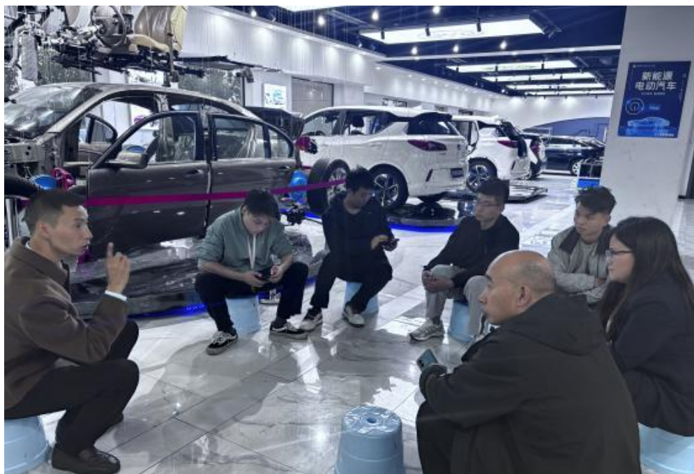
图 34：教研组周教研会议（新能源汽修专业）