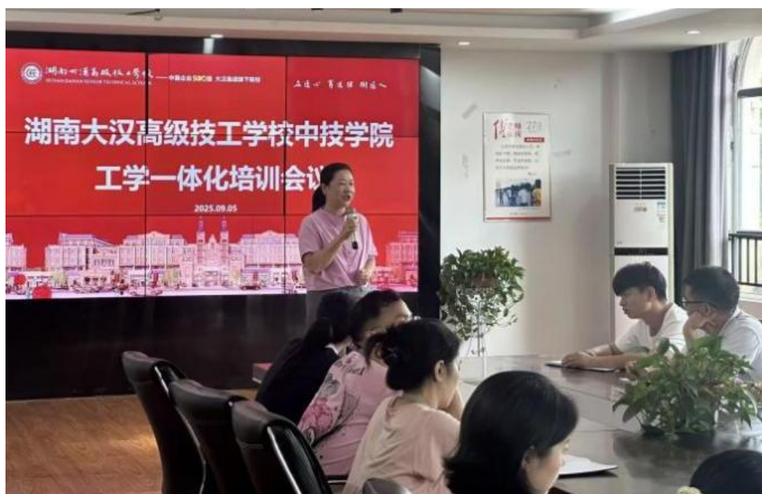
图30：校内工学一体化培训