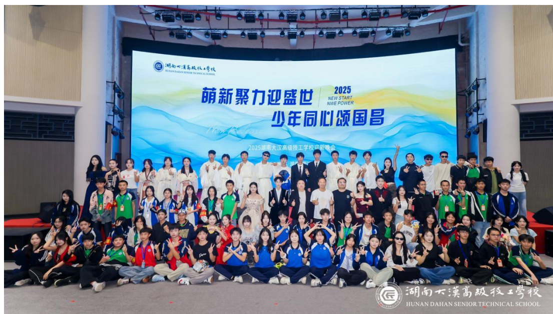
图 16:2025 年迎新晚会现场合影