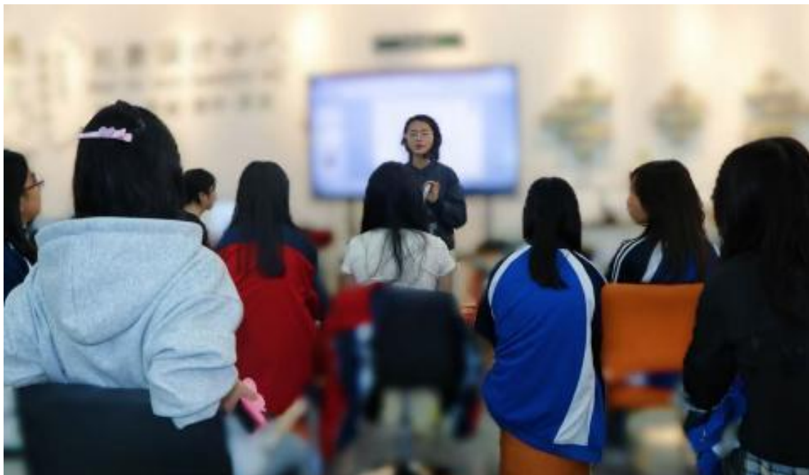
图38：形象设计专业学生进行赛前集训

一是赛事参与度与覆盖面显著提升。相较于往年，本年度参赛专业从传统技能类拓展至美育、体育等多个领域，实现了专业全覆盖与赛事类型多样化的双重突破，体现了学校全面发展的育人理念。二是竞赛成果质量稳步提高，在省级赛事中不仅斩获团体荣誉，更在个人奖项中多点开花，奖牌数量与等级较往年有明显提升，彰显了教学质量的扎实成效。三是赛前筹备工作扎实高效，针对不同赛事特点，组建专业辅导团队，制定个性化训练方案，通过校内选拔赛、集中集训、模拟竞赛等多种形式，有效提升选手竞技水平。同时，积极对接赛事组委会，精准解读竞赛规则，确保参赛工作有序推进。四是校企协同赋能竞赛备战，充分发挥兼职教师行业一线实践优势，邀请企业专家参与赛前指导，将行业最新标准与技术融入训练环节，助力选手快速提升实战能力。