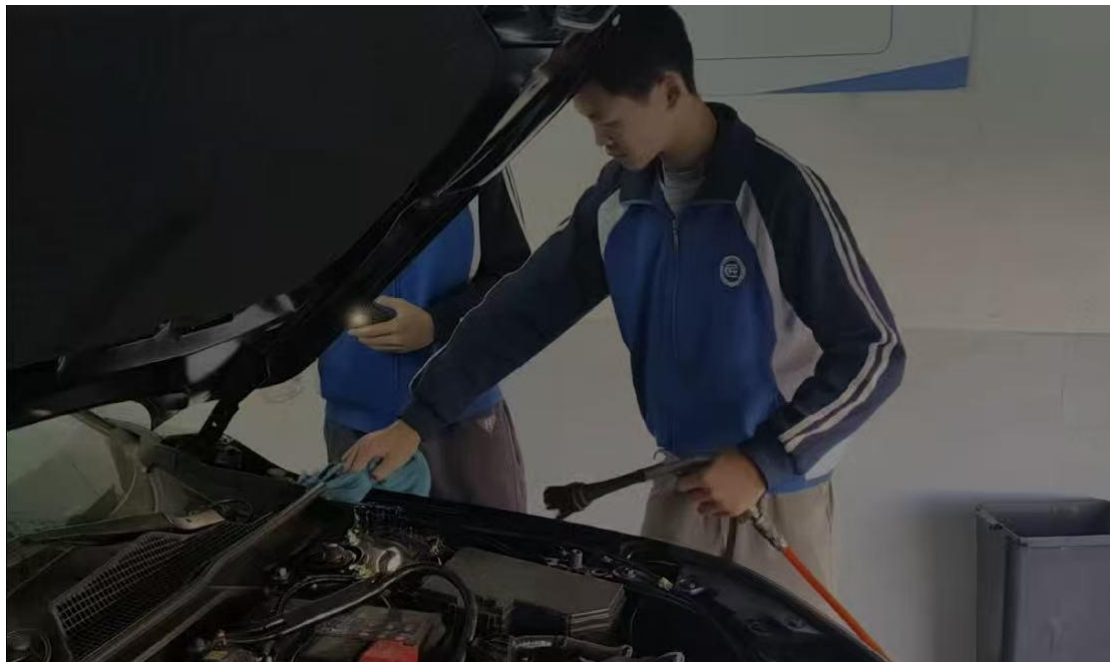
图21：新能源汽修专业学生进行车辆检修

台，将企业真实生产场景引入教学，不仅提升了学生实践技能，更实现了营收突破，构建“学做合一、产教共生”的育人生态。