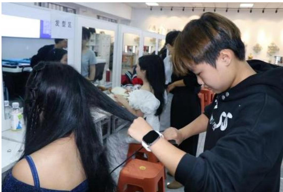
图22：形象设计专业学生为金联社区文艺活动化妆