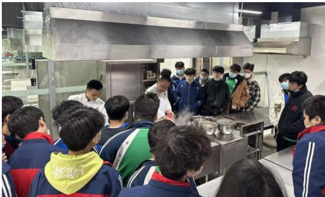
图23：大碗先生区域总厨给烹饪学生授课

校企协同不断深化。积极推行“双师共育”模式，引进企业技术骨干走进课堂，深度参与形象设计等专业的人才培养方案制定与课程改革，将行业前沿技术、岗位实操标准融入教学全过程，有效弥补了校企育人鸿沟，提升了人才培养的针对性与实用性。