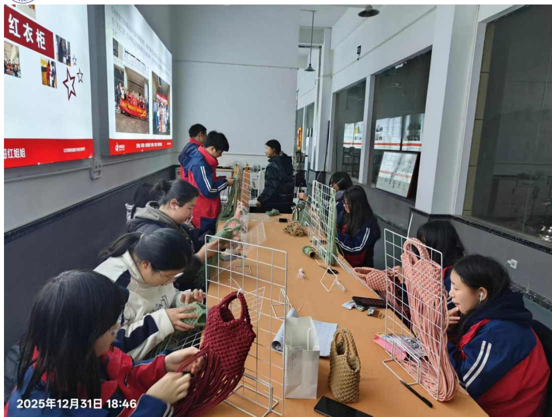
图 15：编织社团编织包包

案例 7：《以“迎新”与“元旦”晚会为载体丰富在校体验》。学校长期坚持将迎新晚会和元旦晚会作为校园文化建设的重要载体，两项传统活动贯穿学年始终，既是校园文化传承的仪式表达，也是展现学生风采的美育平台。