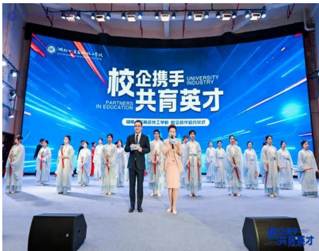
图 2：学校举办大型校企合作签约授牌仪式