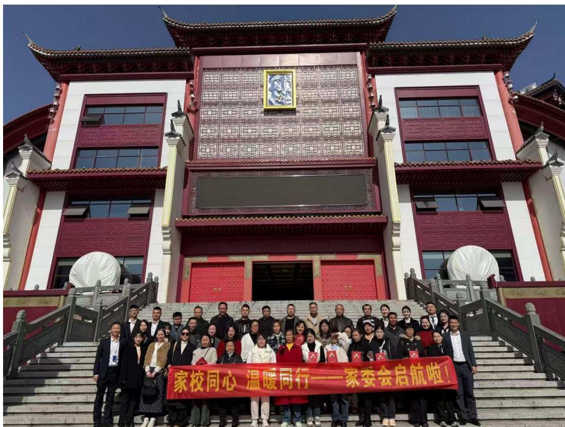
图12：学校成立家委会

学校正式成立家长委员会，设立家校心理健康协作机制，通过定期座谈、主题沙龙与开放日等活动，促进家庭教育与学校心理工作的有效衔接，共同守护学生身心健康发展。