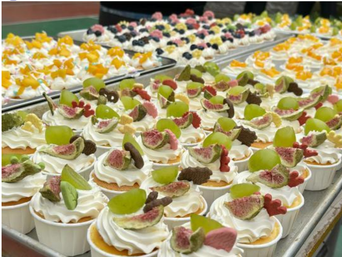
图40:23级烹饪专业学生承接毕业班毕业团建聚餐