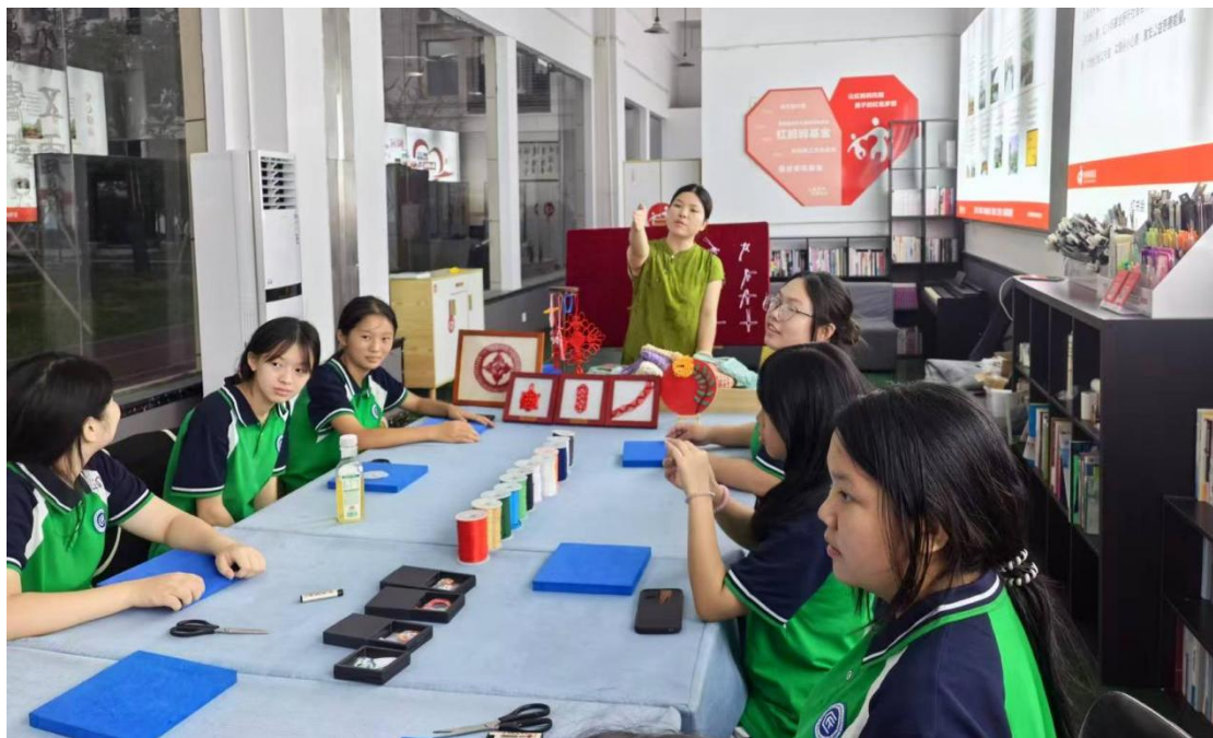
图11：传统文化社团开课

我校注重工匠精神的具象化培育与沉浸式传承。通过举办“校友工匠面对面”活动，邀请深耕行业的优秀校友重返校园，以亲身经历讲述从生涩学徒到行业能手的成长之路，将“精益求精、持之以恒”的职业信念化为生动一课。校园内，国画、编织、茶艺等传统文化社团蓬勃开展，学生在笔墨经纬、指尖技艺中涵养心性，体验“如切如磋、如琢如磨”的匠心境界。同时，学校将工匠精神融入日常规范，在实训室、学生宿舍全面推行以“整理、整顿、清扫、清洁、素养、安全”为核心的6S管理，引导学生从工具归位、环境整洁、流程规范等细节做起，使严谨细致、追求卓越的工匠态度从理念外化为可感可行的日常行为，在潜移默化中塑造学生的职业习惯与精神底色。