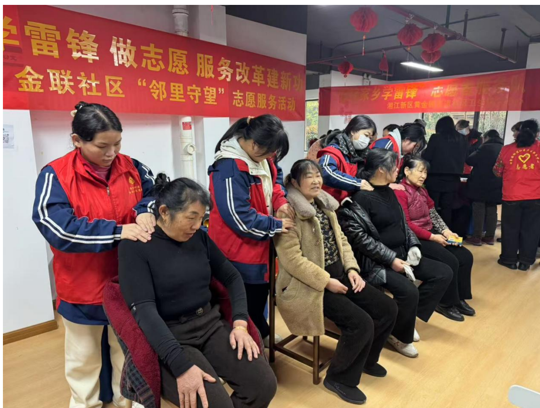
图 9：康复保健学子为社区人员进行按摩

当代青少年的良好风貌，实现了“以劳树德、以劳育人”的目标，为构建和谐社区贡献了青春力量。