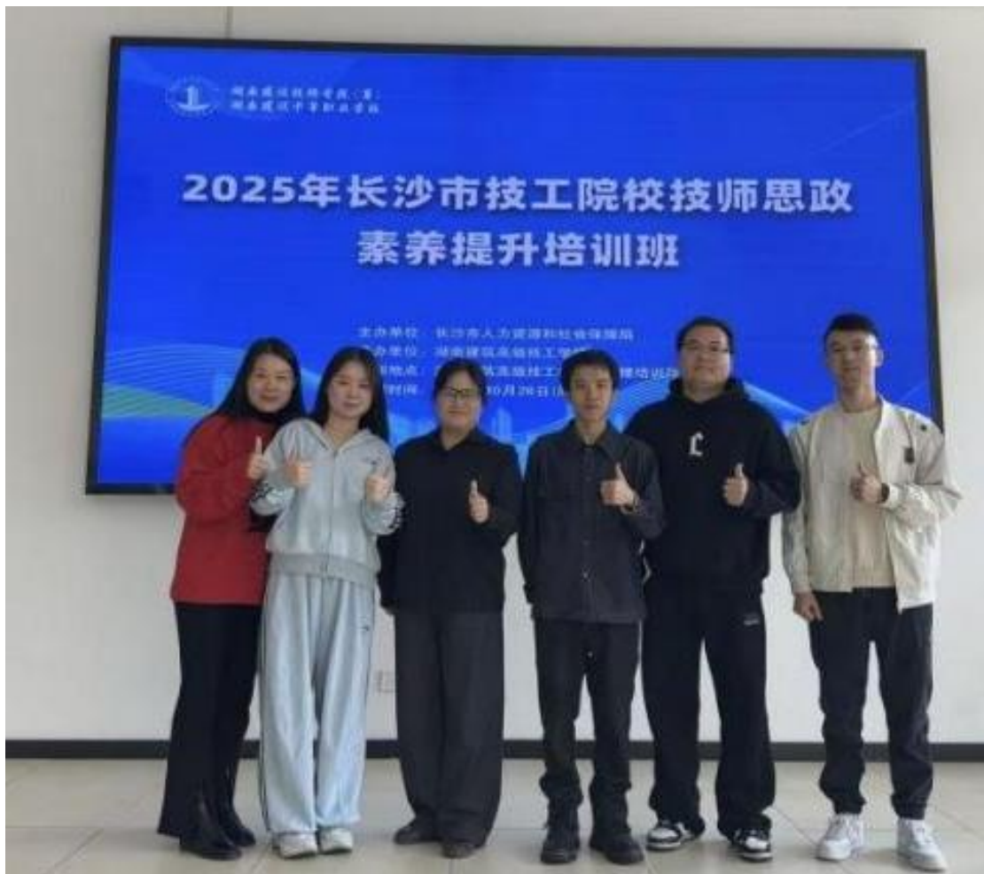
图 31：教师参加长沙市技工院校技师思政素养提升培训班

师资队伍建设工作持续走深走实。将师德师风建设置于核心位置，常态化开展系列专题教育，引导教师筑牢正确教育观、价值观与职业道德根基；同时健全师德师风考核评价机制，把师德表现作为教师绩效考核、职称晋升的关键依据，全力营造风清气正、敬业育人的优良教育教学氛围。