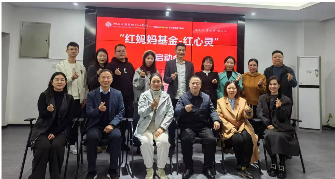
图13：红心灵启动仪式

老师在校值班，确保心理咨询服务的常规化与可及性。预约：通过线上预约系统、心理咨询室门口预约表或班主任转介等多种方式进行预约，保护学生隐私。线上心理信箱：设立匿名“树洞”心理信箱，为学生提供一个低门槛的初始求助渠道，由心理老师定期回复。紧急联系通道：建立针对心理危机的紧急联系通道，确保特殊情况能得到及时响应。